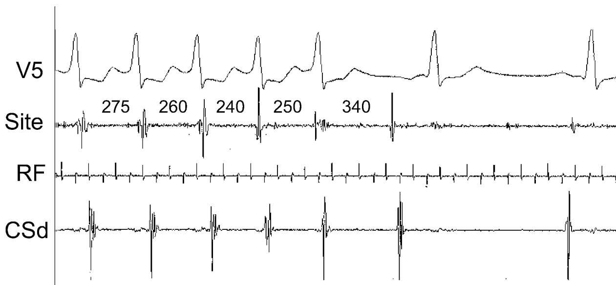
Ablazione efficace della tachicardia atriale. L'erogazione di radiofrequenza iniziava 2 secondi prima dell'inizio di questa figura. C'è un progressivo accorciamento del ciclo della tachicardia, quindi il ciclo allunga per 2 battiti prima dell'interruzione della tachicardia. Site, sede di erogazione di radiofrequenza; RF, marker di erogazione di radiofrequenza; CSd, porzione distale del seno coronarico