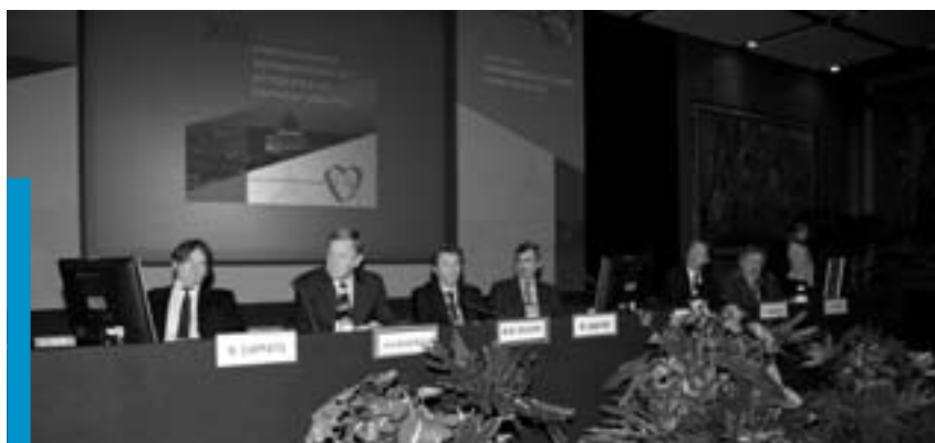
UN MOMENTO DI UNA SESSIONE DI LAVORO NEL CORSO DEL XIII SYMPOSIUM ON PROGRESS IN CLINICAL PACING.

tutti gli argomenti più attuali. Riguardo all'elettrofisiologia lo spazio maggiore è stato riservato alle tecniche ablativo, sia percutanee che chirurgiche, della fibrillazione atriale, in particolare all'utilizzo della crioablazione, al fine di ridurre l'uso della radiofrequenza, che è gravata da maggiori rischi ed effetti collaterali; ha suscitato molto interesse anche la sempre maggiore diffusione delle ablazioni epicardiche, finalizzate al trattamento delle tachiaritmie ventricolari in pazienti con cicatrici post-infartuali. Per quanto riguarda l'elettrostimolazione, l'argomento principe è stato invece la resin-