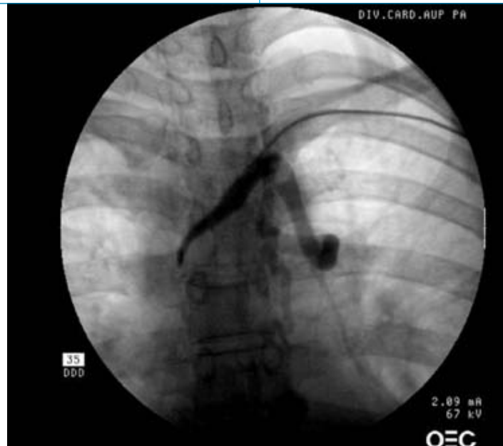
Figura 1. Anomala comunicazione fra il sistema venoso brachiocefalico di sinistra e la vena cava superiore alla venografia.